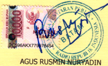
AGUS RUSMIN NURYADIN